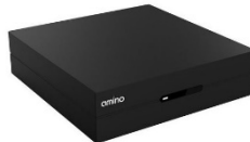
TV Box Amino Aria