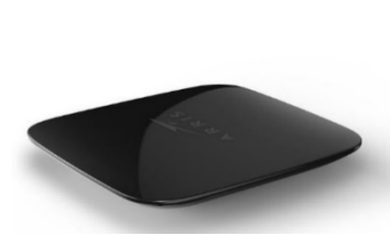
TV Box Arris